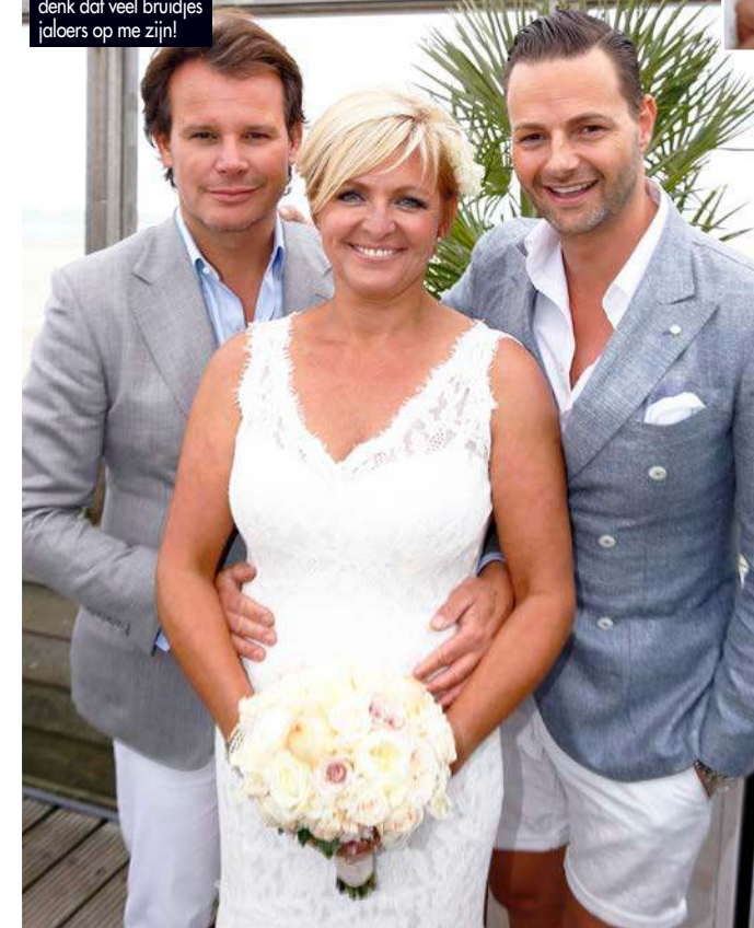
Mijn dreamteam. Ik denk dat veel bruidjes jaloers op me zijn!