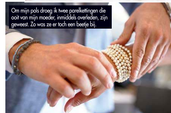
Om mijn pols droeg ik twee parelkettingen die ooit van mijn moeder, inmiddels overleden, zijn geweest. Zo was ze er toch een beetje bij.