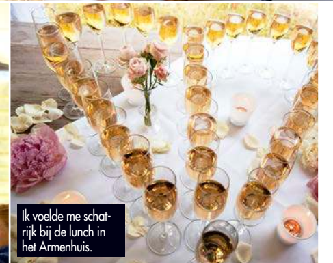
Ik voelde me schatrijk bij de lunch in het Armenhuis.