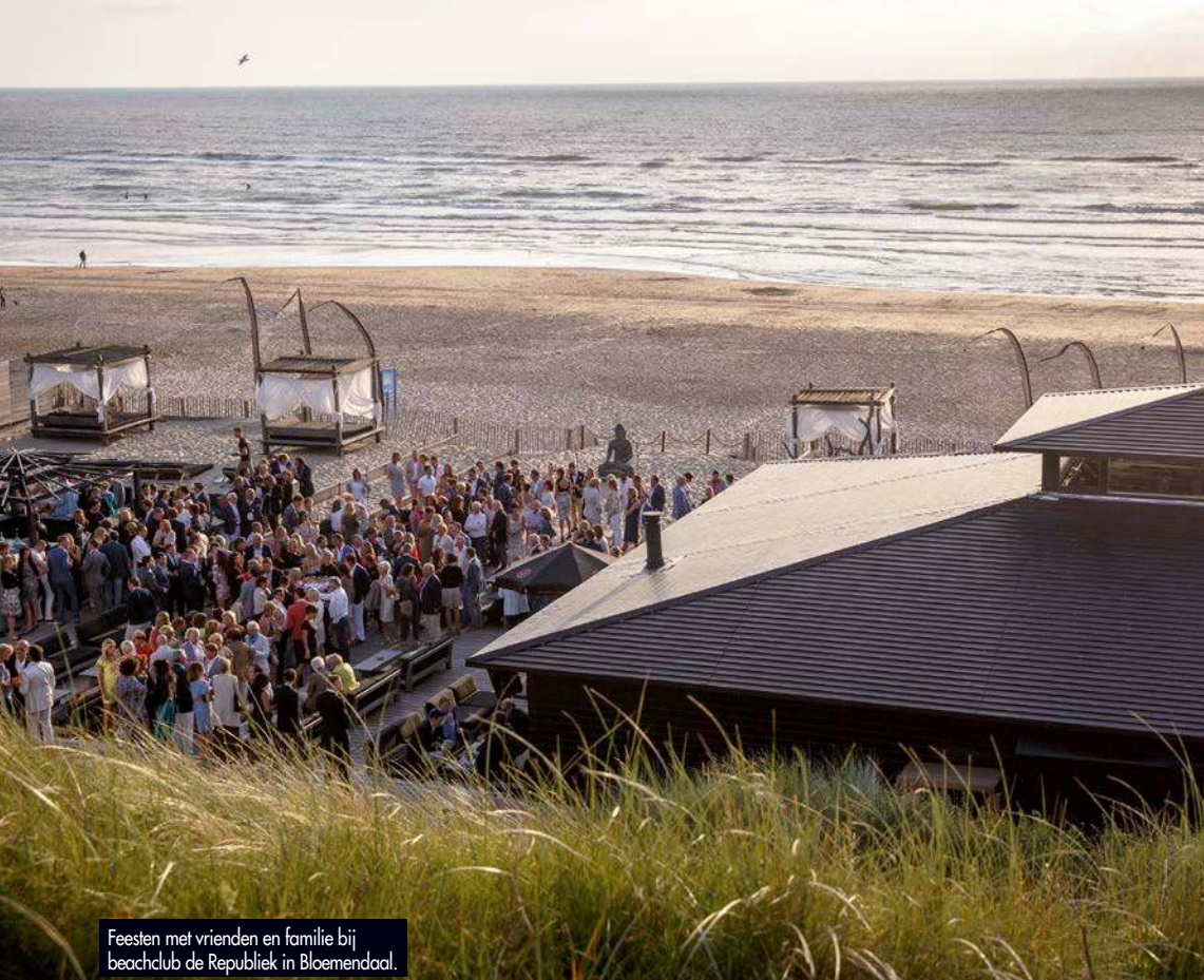
Feesten met vrienden en familie bij beachclub de Republiek in Bloemendaal.