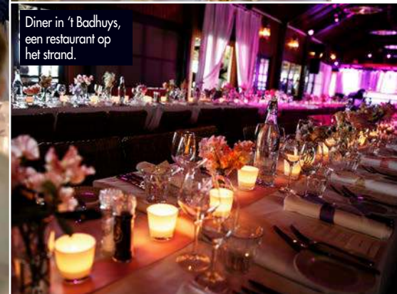
Diner in 't Badhuys, een restaurant op het strand.