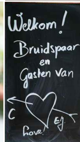
Welkom! Bruidspaar en Gasten van Love!