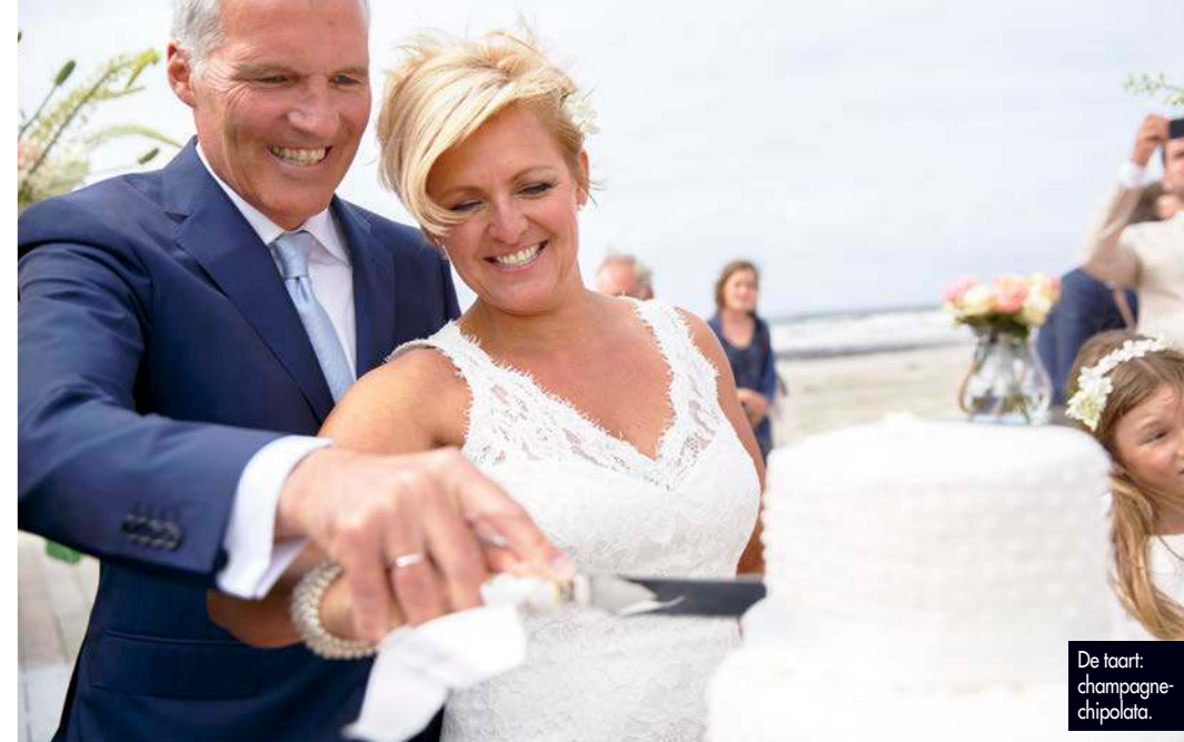
De taart: champagne-chipolata.