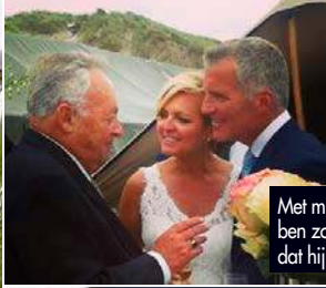
Met mijn vader. Ik ben zo dankbaar dat hij er nog is.