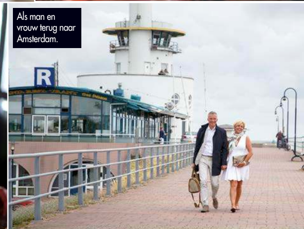
Als man en vrouw terug naar Amsterdam.