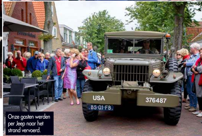
Onze gasten werden per Jeep naar het strand vervoerd.